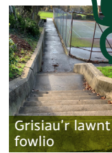
Grisiau'r lawnt fowlio