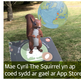
Mae Cyril The Squirrel yn ap coed sydd ar gael ar App Store