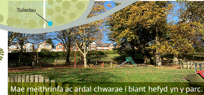
Mae meithrinfa ac ardal chwarae i blant hefyd yn y parc.

I gyrraedd y lefel nesaf uwchben y cyrtiau tennis mae 14 o risiau yn eich arwain at y lawnt fowlio sydd mewn lleoliad prydferth iawn ac sydd â'i gysgod ei hun gyda seddau'n edrych dros y cyrtiau tennis.