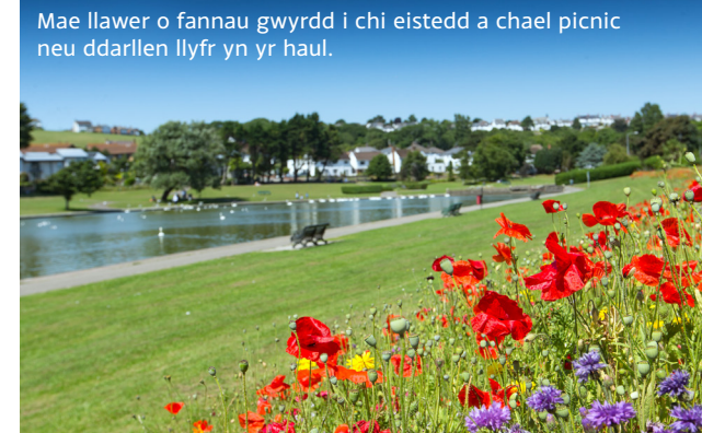
Mae llawer o fannau gwyrdd i chi eistedd a chael picnic neu ddarllen llyfr yn yr haul.