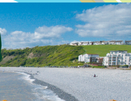
Promenâd y Cnap a'r traeth cerrig mân.

Mae 10 mainc o amgylch y pwll felly mae digon o lefydd i gael picnic. Dylid bod yn ofalus wrth gerdded o amgylch y pwll gan y gall y slabiau fynd yn llithrig pan fyddant yn wlyb.