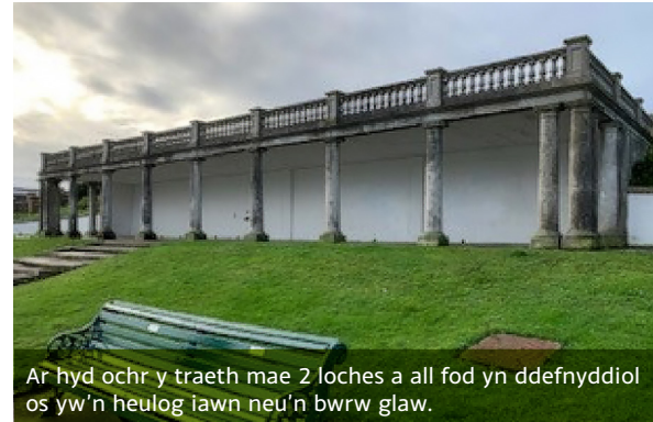
Ar hyd ochr y traeth mae 2 loches a all fod yn ddefnyddiol os yw'n heulog iawn neu'n bwrw glaw.

Mae 10 mainc o amgylch y pwll felly mae digon o lefydd i gael picnic. Dylid bod yn ofalus wrth gerdded o amgylch y pwll gan y gall y slabiau fynd yn llithrig pan fyddant yn wlyb.