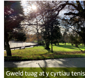
Gweld tuag at y cyrtiau tennis